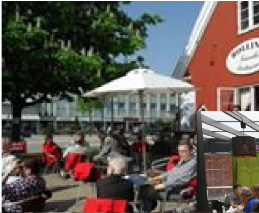
Formanden var glad for tilslutningen til brunchen på Bolini's søndag den 22. maj