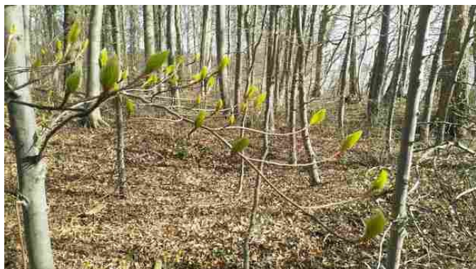
Sydfynsk bøgeskov